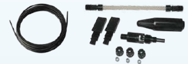
TABLA DE ESPECIFICACIONES